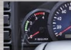
Tachometer Mempermudah penyesuaian putaran mesin dengan kecepatan kendaraan, agar irit BBM.