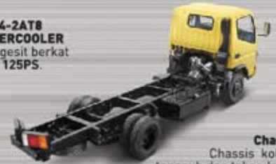
Chassis Chassis kokoh, tangguh dan tahan lama.