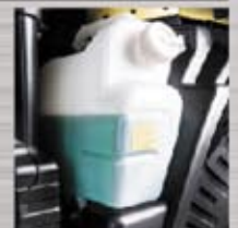
Tangki Radiator Posisi di bagian luar sehingga mudah dikontrol.