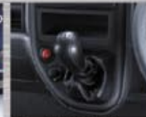
Mitsubishi in Dash Gear Shift Tuas transmisi menyatu dengan dashboard, kabin lega.