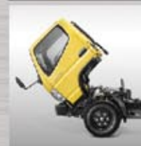
Kabin Jungkit Mudah dalam pemeriksaan dan perawatan mesin.