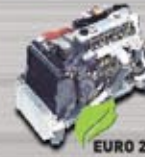
MESIN 4D34-2AT8 TURBO INTERCOOLER Lincah dan gesit berkat daya mesin 125PS.