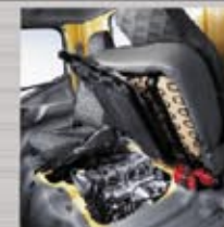
Inspection Lid Berada di bawah jok penumpang, pengecekan mesin lebih mudah.