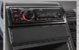
Radio/USB/MP3 Menambah kenyamanan dan menemani sepanjang perjalanan