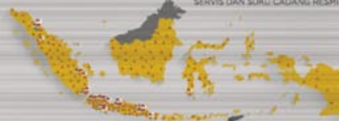
JARINGAN TERLUAS SERVIS DAN SUKU CADANG RESMI