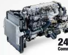
240PS Common Rail