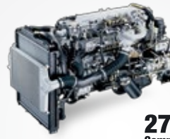
270PS Common Rail

MESIN 6M60 Dengan tenaga 270 PS menggunakan sistem Common Rail yang dikontrol oleh Electronic Control Unit (ECU).